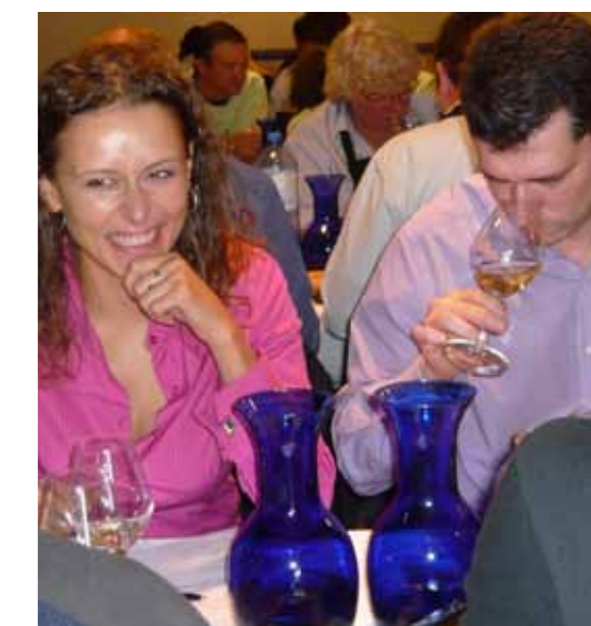
Un moment de distensió durant el tast

El passat dissabte dia 15 d'octubre va tenir lloc la final de la 4a edició del Campionat d'Europa de Tast , organitzat per La Revue du Vin de France a Torroja del Priorat. Aquesta és la publicació especialitzada en vins de més difusió i influència a França.