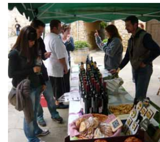
Per primer any, la Festa del Vin Blanc es va desenvolupar conjuntament a Escaladei i a la Morera

Durant la jornada es va disposar un punt de venda dels vins locals amb descomptes d'entre un 15 i un 20% sobre els preus habituals. A banda, l'organització va habilitar una zona infantil per a la mainada amb inflables i contacontes.