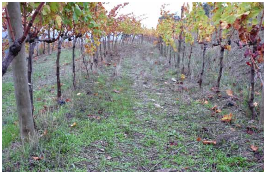
Coberta vegetal, vinya amb activitat biològica al sòl

Així, doncs, si volem tenir vinyes sanes, les hem de tenir ben "alimentades" i en un sòl amb les millors condicions possibles. Per tal d'afavorir aquests aspectes fora bo minimitzar els tractaments fitosanitaris (ja que poden afectar fatalment la fauna del sòl), evitar l'ús d'herbicides i d'adobs minerals fomentant així les cobertes vegetals, ja siguin permanents o temporals, i tenir uns nivells òptims de matèria orgànica. També caldria evitar l'ús de maquinària pesant que ens compacta en excés el sòl i prescindir dels clàssics subsolats agressius que en trenquen l'estructura.