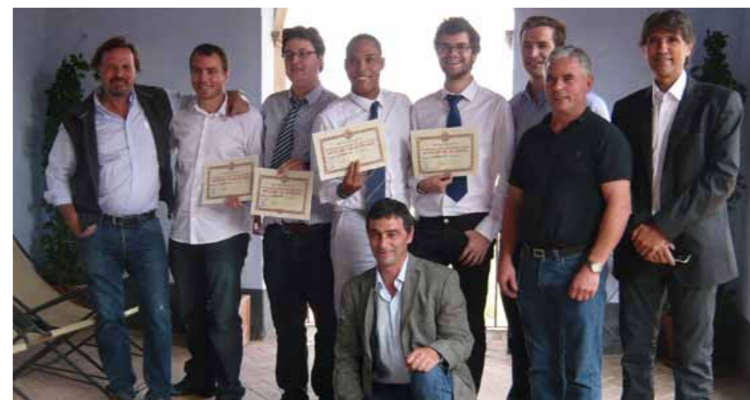
L'equip del Quebec, guanyador del certamen, amb el president de la DOQ Priorat

CAMPIONAT D'EUROPA DE TAST DE LA REVUE DU VIN DE FRANCE ]