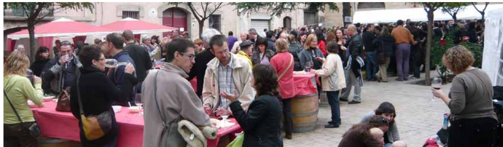
Plaça de Catalunya de Porrera durant el Tasta Porrera

Austràlia, va remarcar la tipicitat i atractiu que pot oferir el Priorat i els seus vins en un entorn mundial on l'enoturisme acostuma a caure en l'oferta molt comercial i poc centrada en els valors de qualitat i autenticitat. La festa del 10 de setembre va tenir com a activitat prèvia una jornada de portes obertes dissabte, dia 3 de setembre, en què els diferents cellers de Poboleda van acollir els visitants interessats a conèixer directament els espais i processos de producció dels vins locals.