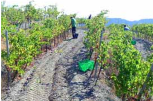
Una vinya aforada a la Vilella Alta

Un any més, la DOQ Priorat va disposar d'un equip de veedors amb la finalitat de fer tant controls a cellers com aforaments a les vinyes amb el clar objectiu de garantir un correcte compliment de la normativa interna vetllant,