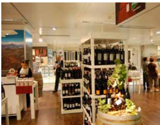
Detall d'alguns dels productes exposats

El passat mes d'octubre, la DOQ Priorat va ser present a una mostra gastronòmica de productes de la comarca del Priorat a El Corte Inglés de Tarragona. La mostra "Comarca Priorat, cultura de qualitat" va ser impulsada pel Consell